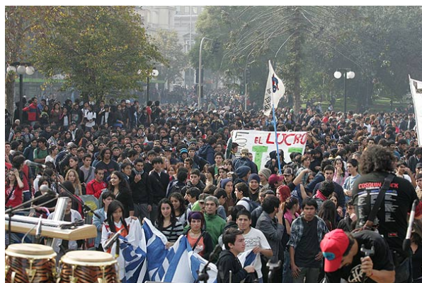
Durante el mes de noviembre se registraron menos manifestaciones estudiantiles en el país.