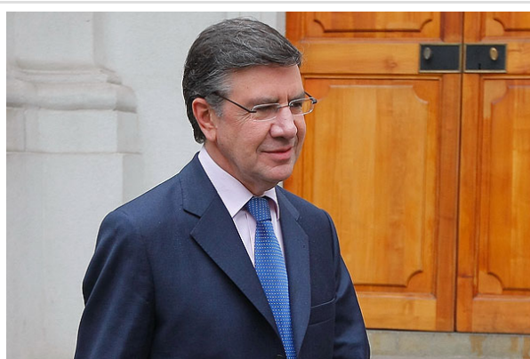
"Yo no siento que necesite declaraciones políticas de apoyo", sostuvo el ministro de Educación.