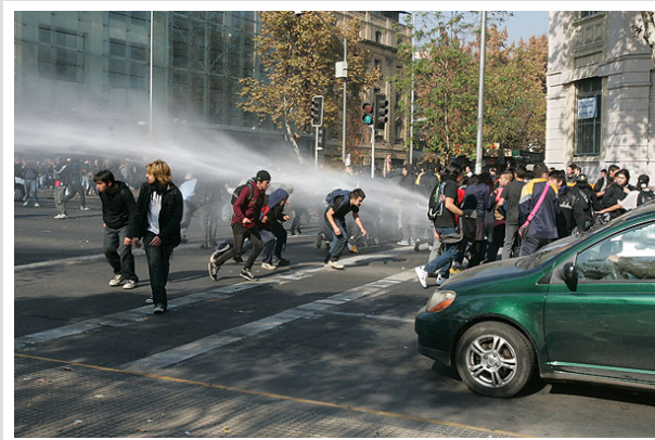
Cuando culminaba la manifestación se registraron incidentes frente al Mineduc y La Moneda.