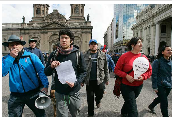
Los dirigentes de la Aces rechazan la reunión programada para este sábado a la que convocó el Gobierno.