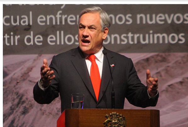
El Presidente Sebastián Piñera habló en la cena de la Sonami realizada en CasaPiedra.

Emol Jueves, 1 de Septiembre de 2011, 01:27