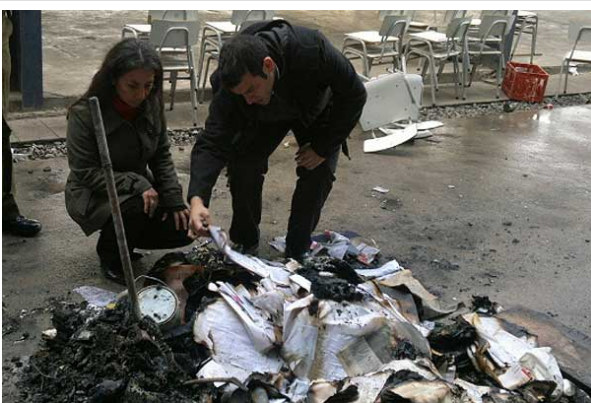
El alcalde de Estación Central, Rodrigo Delgado, lamentó los daños en el recinto educacional.