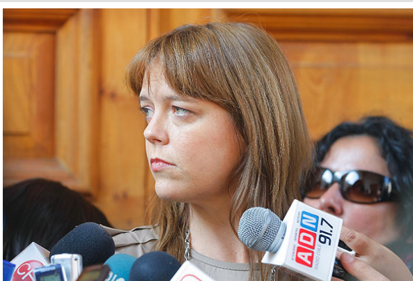
La vocera sostuvo que hay una "cierta campaña de desinformación" en el tema energético.