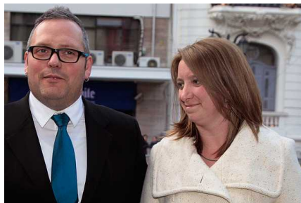
Caso Caval: Abogado que envió