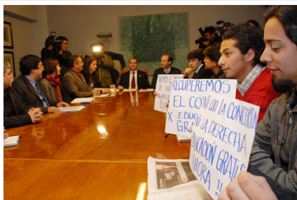
Los dirigentes estudiantiles han mantenido una postura crítica frente a las proposiciones gubernamentales sobre educación.