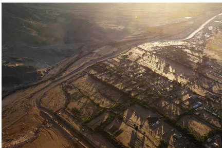
Alcalde de Tierra Amarilla afirma que