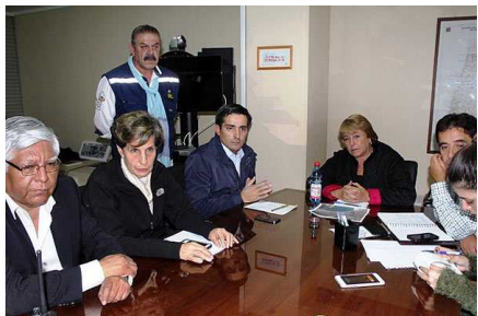
Peñailillo precisó que toque de