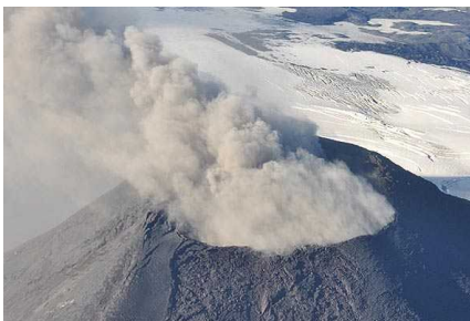
Aumenta actividad del volcán Villarrica y sus fumarolas superan los 800 metros