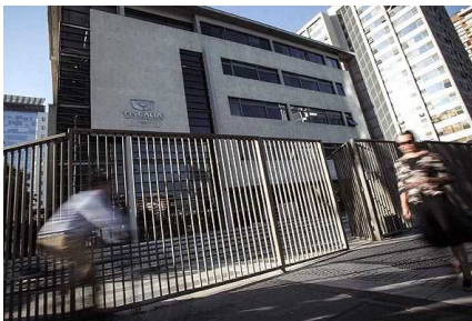
Fiscalía decreta prisión preventiva