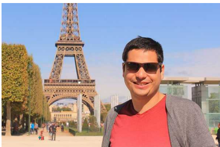
Turista chileno muere tras caer por barranco cuando tomaba foto con su polola en Tailandia