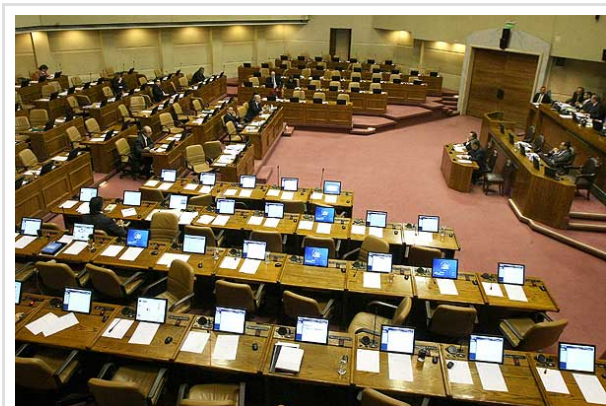
En una sala semivacía de la Cámara de Diputados se realizó la sesión especial por seguridad ciudadana a la que fue llamado el ministro del Interior, Rodrigo Hinzpeter.