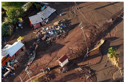
Aseguran que mujeres encerradas en un container fueron arrastradas por alud en Tierra Amarilla