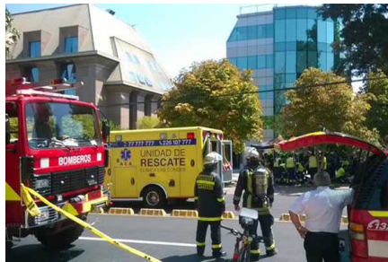
Tres muertos y cinco lesionados por inhalación de gas en clínica de Vitacura