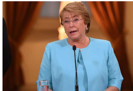
Presidenta Bachelet lanza Bono Marzo 2015: Revise si fue beneficiado