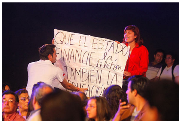
Los estudiantes alcanzaron a desplegar un lienzo antes de ser detectados por Carabineros.