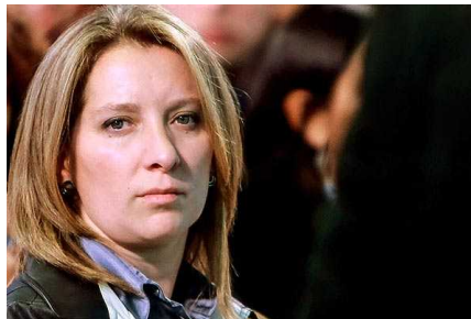
Piden a Contraloría revisar sueldo de consuegra de Bachelet