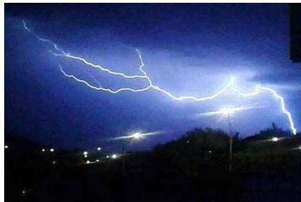
Intensa tormenta eléctrica sorprende a habitantes de Copiapó