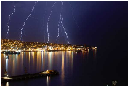
Lluvias afectan desde Antofagasta a la RM, que ya registra tormentas eléctricas