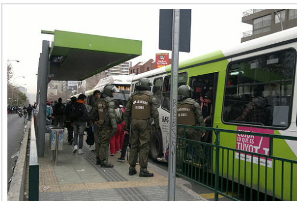
Carabineros baja del Transantiago a estudiantes que intentan llegar a Plaza Italia por esa vía.