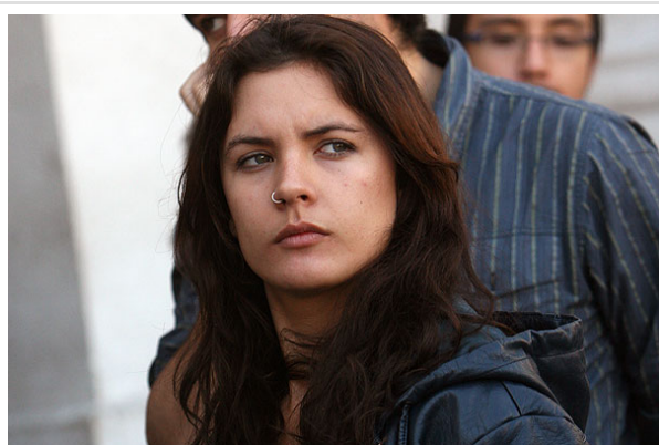
Camila Vallejo también fue afectada por los gases lacrimógenos lanzados por Fuerzas Especiales.