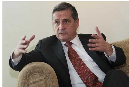
Tribunal Constitucional suspende investigación de la Fiscalía en caso Soquimich