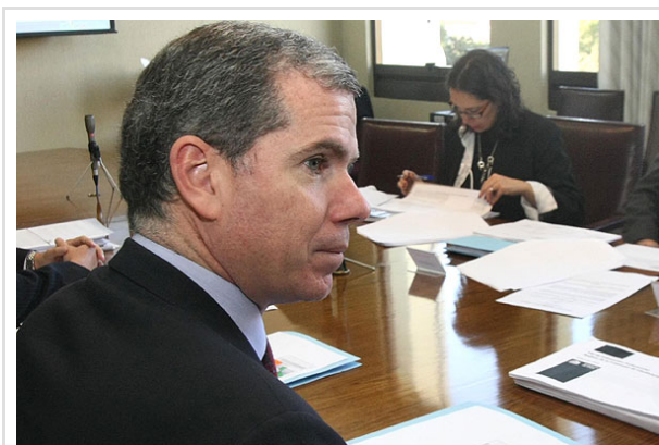
El ministro Bulnes sostuvo que ha tenido "la mejor disposición a dialogar con todos los actores".