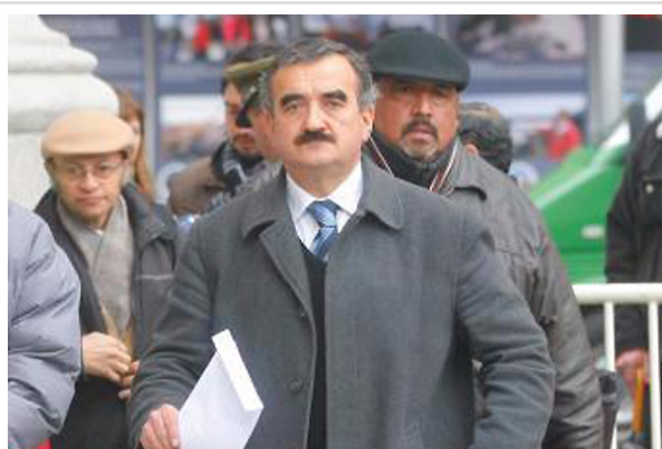
Gajardo dijo ayer que los métodos aplicados contra el movimiento estudiantil "recuerdan a los métodos sionistas del apartheid".