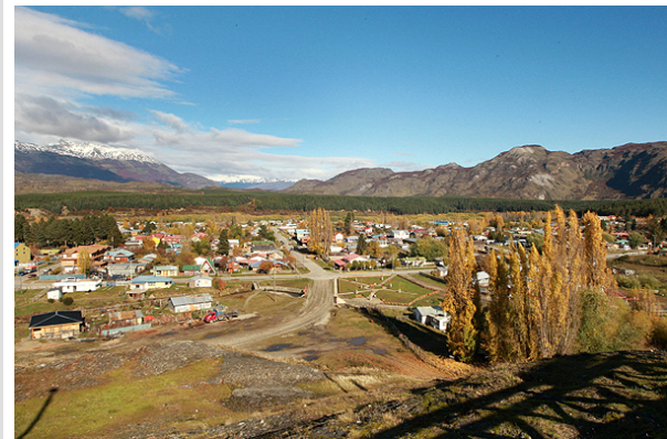
La ciudad de Cochrane será el punto de partida del trazado eléctrico que prevé HidroAysén.