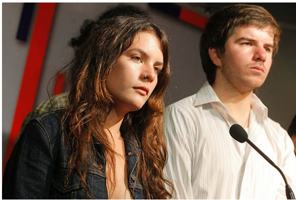
La ciudadanía mantiene el apoyo a las demandas estudiantiles, a 5 meses de iniciado el conflicto.

Emol Miércoles, 5 de Octubre de 2011, 13:22