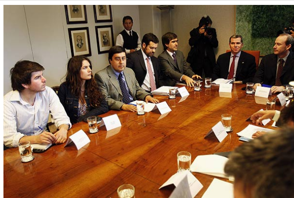
Los secundarios abandonaron la cita en el Mineduc cerca de las 21.00 horas. Mientras que la Confech y el Magisterio continuaron dialogando.