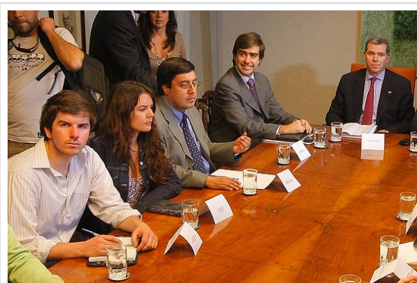
Estudiantes, profesores y el ministro Bulnes participan en segunda sesión de mesa de diálogo.

SANTIAGO.- En medio de un tenso clima, precedido por las declaraciones del Presidente Sebastián Piñera sobre la gratuidad y el anuncio del proyecto de ley que penaliza las tomas violentas, representantes del movimiento estudiantil se volvieron a sentar con el Ejecutivo en una nueva sesión de la mesa de diálogo para intentar destrabar el conflicto.