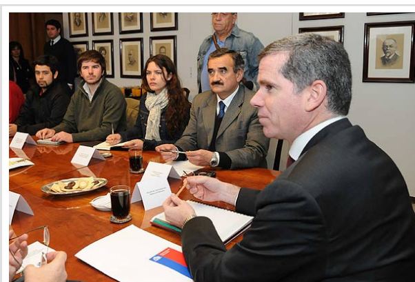
El ministro Bulnes se reunió hoy con los dirigentes estudiantiles para entregarles la propuesta.