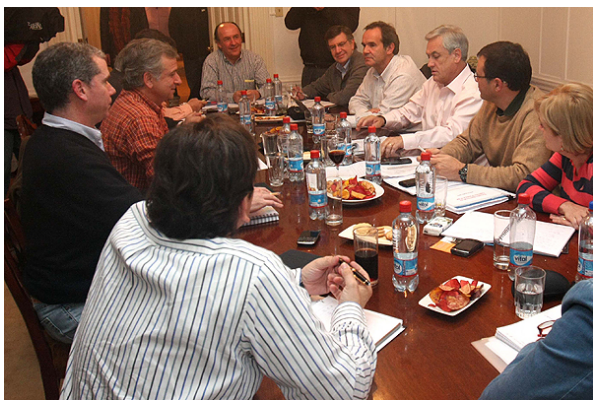
Piñera junto a sus ministros durante la reunión en Machalí.