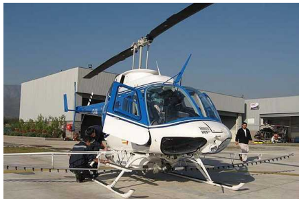
Ocupantes de helicóptero civil extraviado en Atacama no lograron sobrevivir al impacto