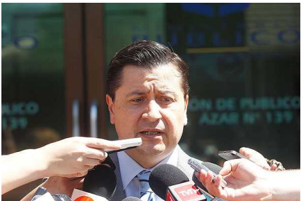
Fiscalía de Rancagua incauta cheque por $2 mil millones destinado a Caval