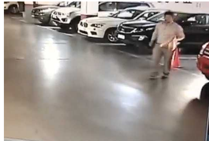
Denuncian millonario robo en estacionamiento de la ciudad de Chillán