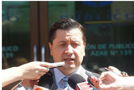
Fiscalía de Rancagua incauta cheque por $2 mil millones destinado a Caval