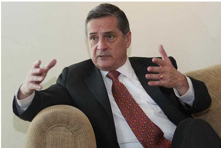
Tribunal Constitucional suspende investigación de la Fiscalía en caso Soquimich