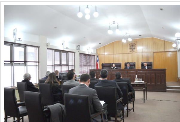
Los alegatos en la Corte de Apelaciones de Puerto Montt antes de que el tribunal adoptara su decisión favorable a HidroAysen.