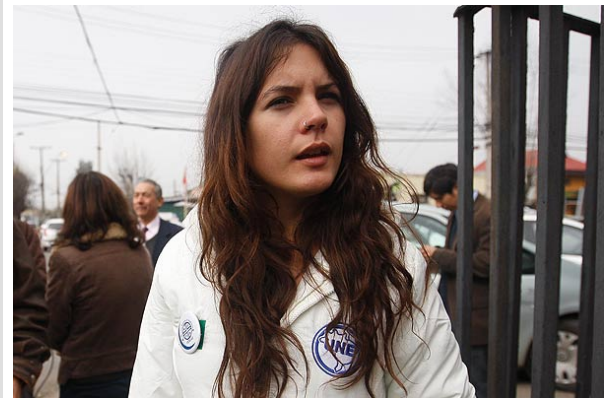
Dirigentes de varias universidades cuestionaron el anuncio de Vallejo de suspender las marchas.