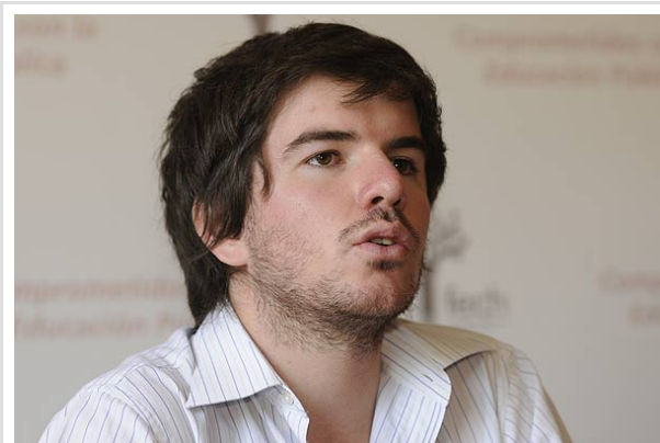
Jackson dijo que no quieren que las mesas de diálogo "sean sólo una foto" con el Gobierno.