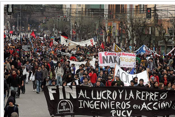
En Valparaíso los estudiantes pretenden marchar a las 11.00 horas desde la Plaza Sotomayor.

SANTIAGO.- Pese a que ayer la presidenta de la FECh, Camila Vallejo, anunció la suspensión del paro nacional de este jueves debido a la tragedia aérea, hoy varias federaciones universitarias de regiones así como los estudiantes secundarios se mostraron contrarios a esta decisión y afirmaron que mantendrán la convocatoria.