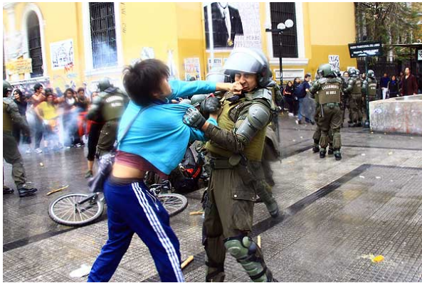
El vocero de Gobierno respaldó a Carabiniero tras los cuestionamientos por la forma en que enfrentaron los desórdenes de ayer.