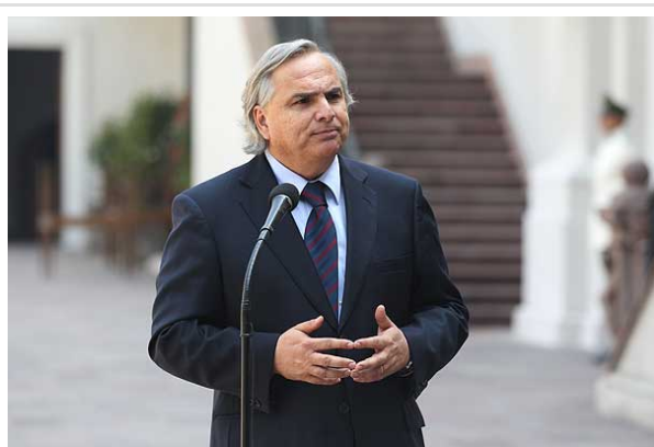
Chadwick afirmó que el proyecto de ley que endurece los delitos de desórdenes públicos y las tomas violentas, va en la línea asumida por el Gobierno para poner fin a los hechos de violencia.