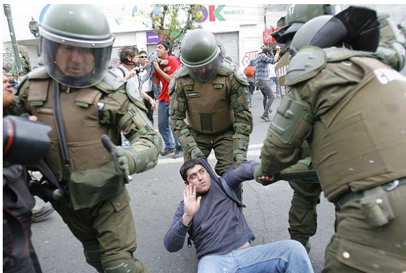
El vocero señaló que se investigarán las denuncias contra Carabineros por exceso de violencia. Un periodista de Chilevisión dijo que ayer fue detenido sin haber provocado a la autoridad.