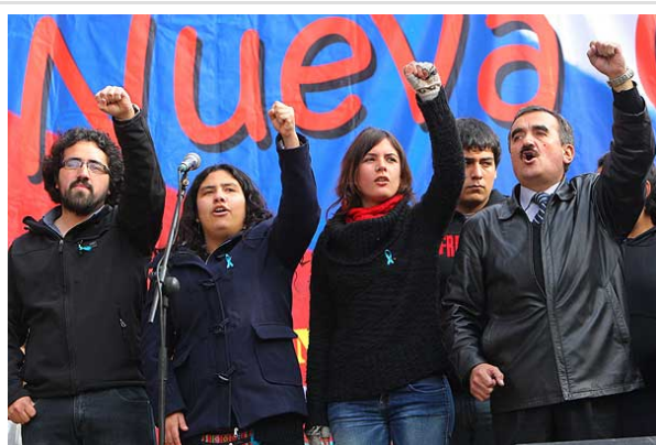
El movimiento estudiantil y distintas agrupaciones sindicales llamaron a un paro nacional para mañana.