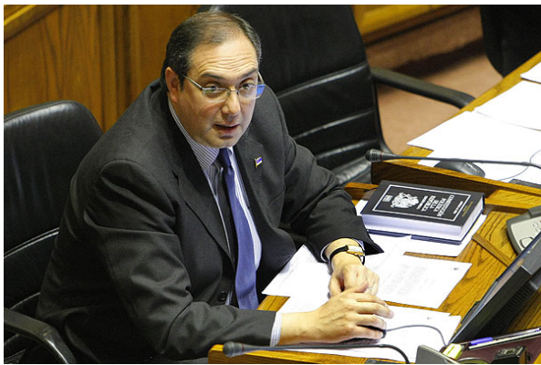
Bianchi llama a decir no a HydroAysén.