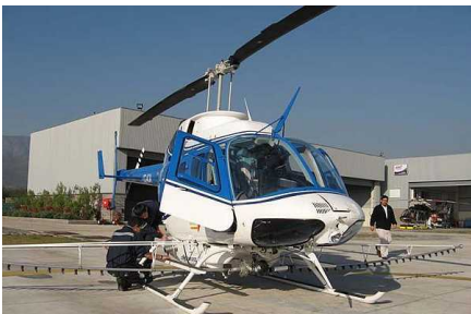
Ocupantes de helicóptero civil