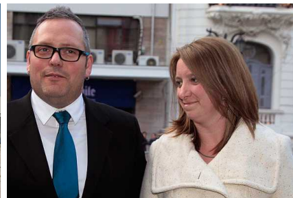
Caso Caval: Abogado que envió