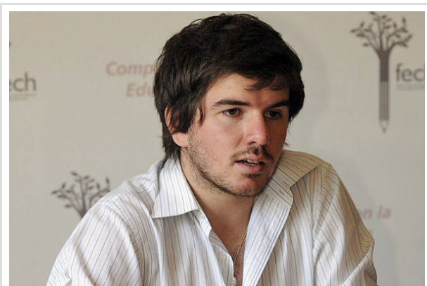
Jackson pide que la directiva de la Confech tenga más atribuciones para tomar decisiones rápidas en medio de las urgencias que plantea el conflicto.