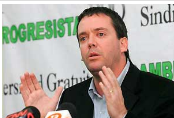
Harboe llamó a Accorsi a "cambiar esta actitud y debatir con argumentos".