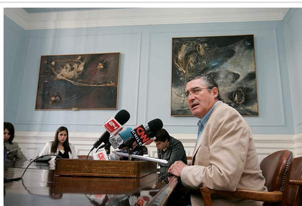
Pizarro pidió permanencia del concepto de educación en el presupuesto del 2012.