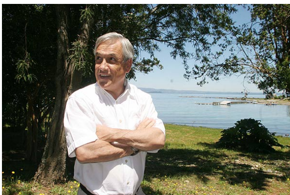
Piñera está descansando junto a su familia en su casa en Bahía Coique, a orillas del lago Ranco.

Emol Domingo, 9 de Octubre de 2011, 14:41