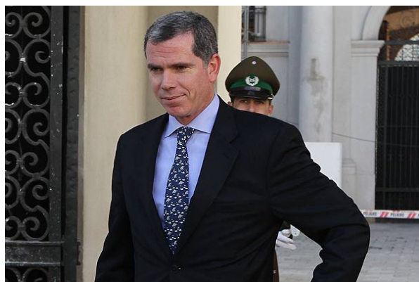
"Queremos creer que entre hoy y el lunes va a resultar una respuesta positiva", dijo el ministro.