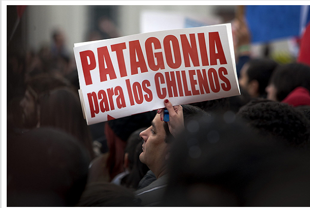
El 28 de mayo pasado, más de 15 mil personas se manifestaron en contra del controvertido proyecto energético.