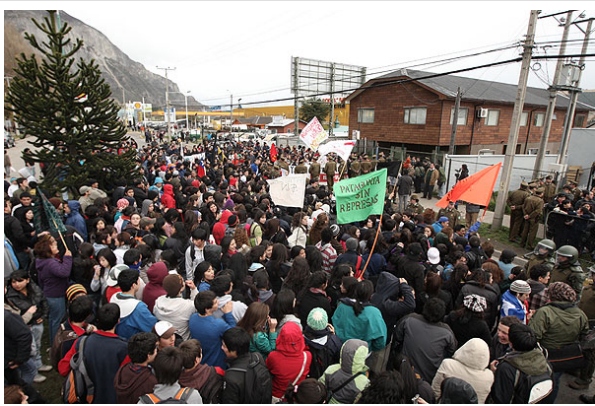
Ayer miles de personas protestaron en Coyhaique contra la autorización para ejecutar el proyecto.