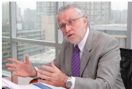
Pacheco confirma interés de Enap por participar en próxima licitación de abastecimiento eléctrico