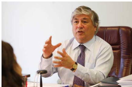
Gerente de Banmédica renuncia por pago "indebido" de compensaciones