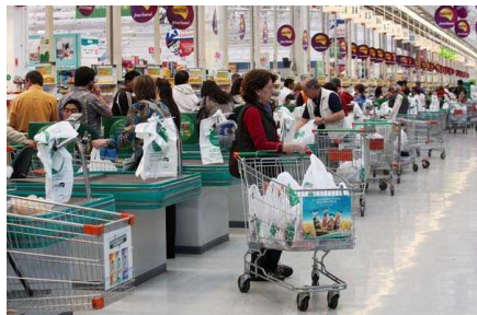
Semana Santa: Supermercados abren normalmente y malls cerrarán el viernes