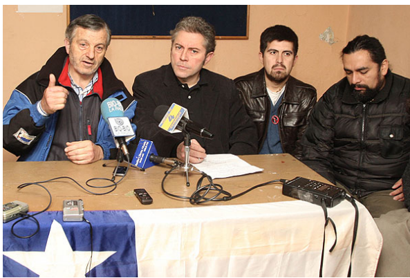
El senador Antonio Horvath llamó al Presidente "a que cumpla sus compromisos ambientales".