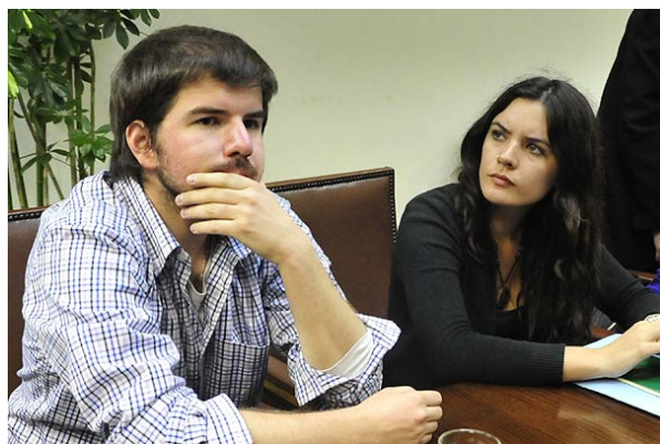
Los líderes de la Confech expusieron hoy ante la Comisión Mixta de Presupuesto en el Senado.