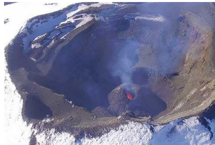
Sernageomin reportó un aumento de