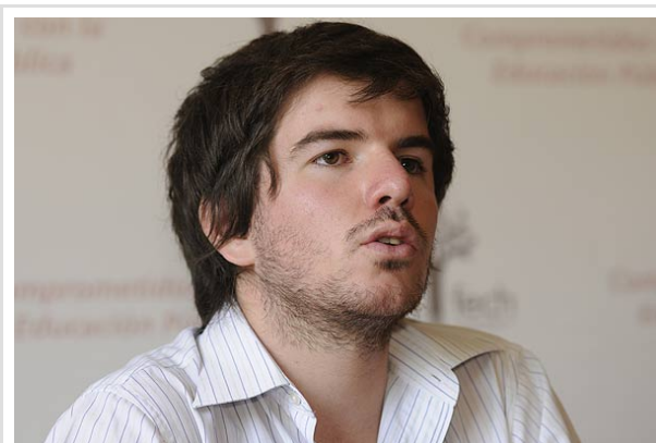
Giorgio Jackson reconoció que "este proceso de transformación va a ser largo" y "va a requerir de mucha paciencia, organización y convicción".