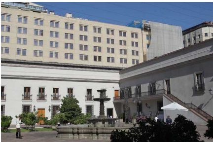
Caso Caval: Realizan incautación en