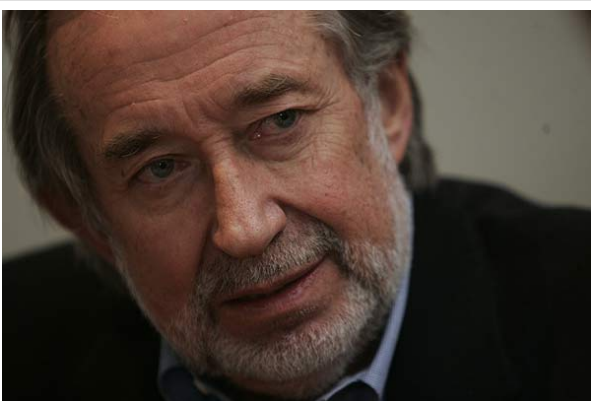
El senador se refirió a los dichos de la Concertación y al Presupuesto 2012.