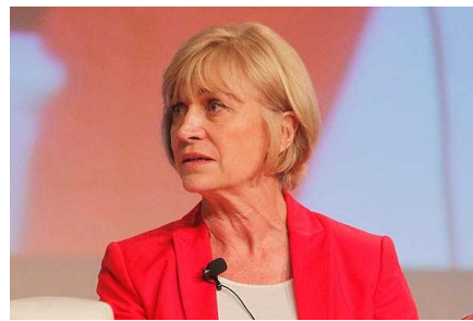
Matthei contra reforma laboral: "Es un desastre y peor que la tributaria"