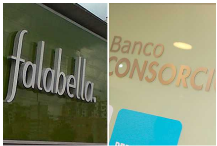
Sernac interpone demandas colectivas contra Falabella y Banco Consorcio