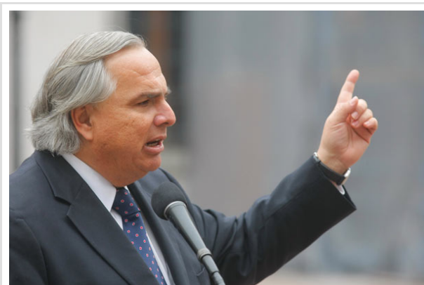
Andrés Chadwick, ministro secretario general de Gobierno.

SANTIAGO.- "Pedimos a nuestros compatriotas que, por favor, cuidemos nuestro país, cuidemos Chile", señaló esta noche el ministro secretario general de Gobierno, Andrés Chadwick, tras el consejo de gabinete realizado en La Moneda.