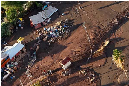
Aseguran que mujeres encerradas en un container fueron arrastradas por alud en Tierra Amarilla