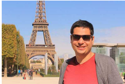
Turista chileno muere tras caer por barranco cuando tomaba foto con su polola en Tailandia