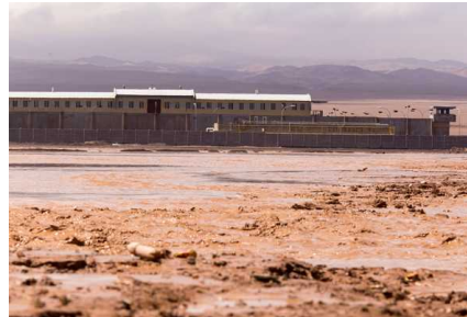
Empresa desmiente encierro de trabajadoras en container durante aluvión en Tierra Amarilla