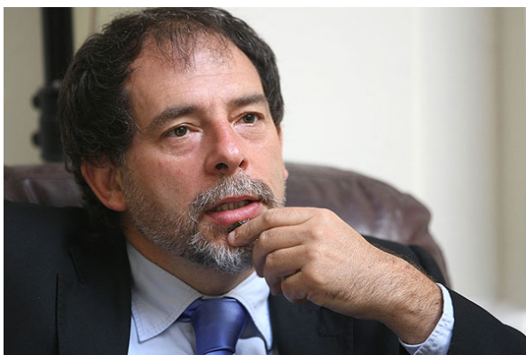
"Aquí el planteamiento del Gobierno va a ser uno más", aseguró el senador Guido Girardi (PPD).